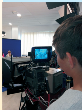
Híradó készítése az MTV-ben

Az MTV székházban a látogatás során betekintheztek a jelmeztárba, a M4 sportcsatorna stúdiójába. A gyerekek számára maradandó pillanatok voltak, mikor kipróbálhatták a híradó készítését, volt aki a bemondó, volt aki a hangmérnök, volt aki az operatőr szerepébe bújhatott, és minderről felvétel is készült. A program részeként meg- néztek egy kisfilmet is a TV és a közmédia történetéről.